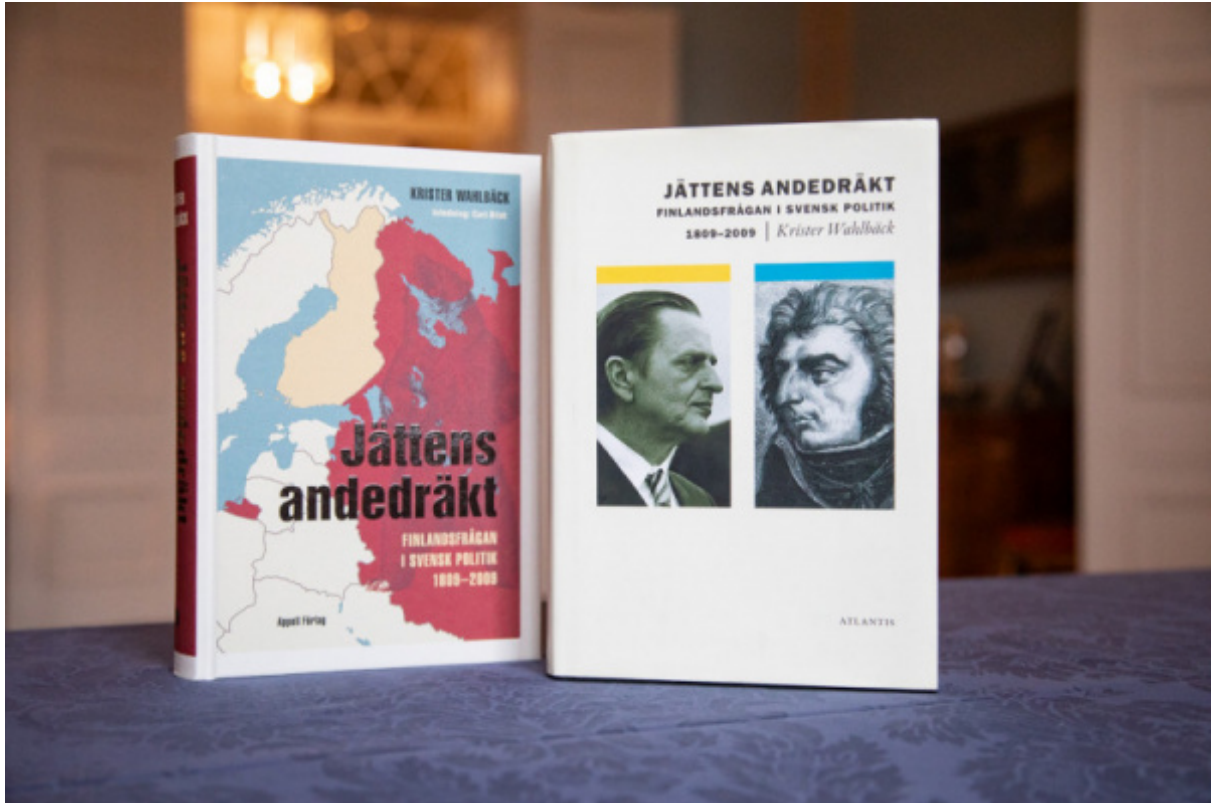
Uusi ja alkuperäinen painos kirjasta Jättens andedräkt – Finlandsfrågan i svensk politik 1809-2009.