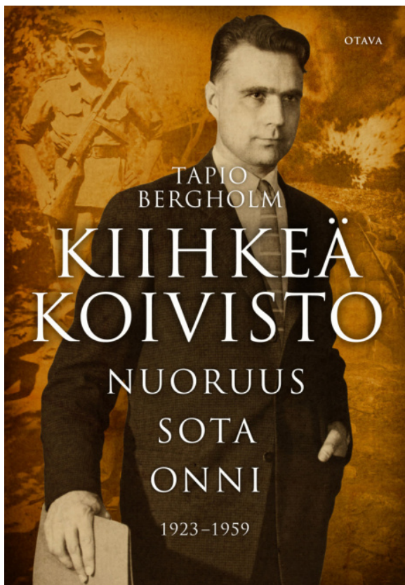
Mauno Koivisto