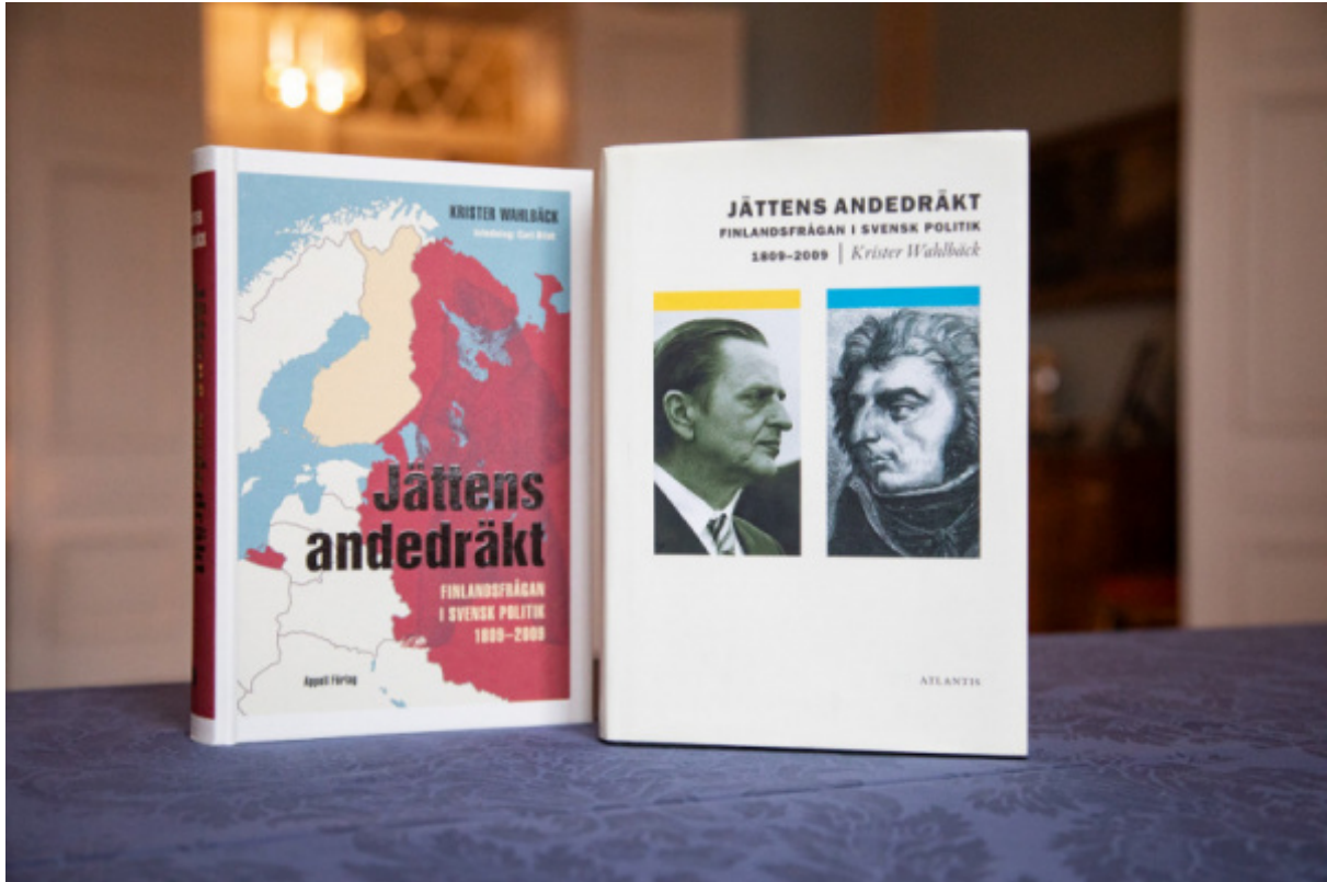
Ny- och originalutgåvan av Jättens andedräkt – Finlandsfrågan i svensk politik 1809-2009.